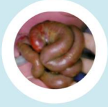
ลำไส้เน่า