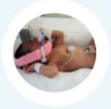
ปอดแตกเปื่อยออกซิเจนไม่ได้ ต้องช่วยหายใจ

ระยะการตั้งครรภ์ที่สั้นสุดก่อน 37 สัปดาห์ หรือที่เรียกว่า "คลอดก่อนกำหนด" ส่งผลให้เกิดอันตรายต่ออวัยวะสำคัญของร่างกายดังแสดงในภาพ บางรายอาจมีผลต่อการเจริญเติบโตและพัฒนาการที่ผิดปกติเมื่อโตขึ้น