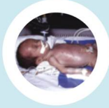
ซอก ติดเชื้อรุนแรง

การป้องกันภาวะคลอดก่อนกำหนดในหญิงตั้งครรภ์สามารถทำได้ง่าย ๆ ดังนี้