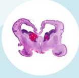
เลือดออกในโพรงสมอง