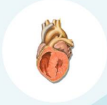
เส้นเลือดไม่ปิดหลังคลอด