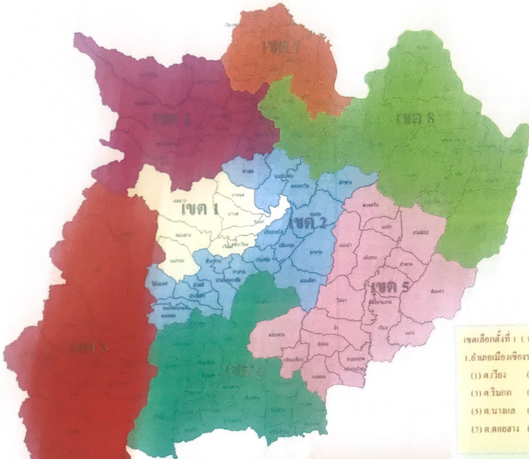
รูปแบบที่ 2

จำนวนประชากร 1,299,636 คน จำนวนราษฎร โดยเฉลี่ย 162,454.50 คน ต่อ ส.ส.หนึ่งคน