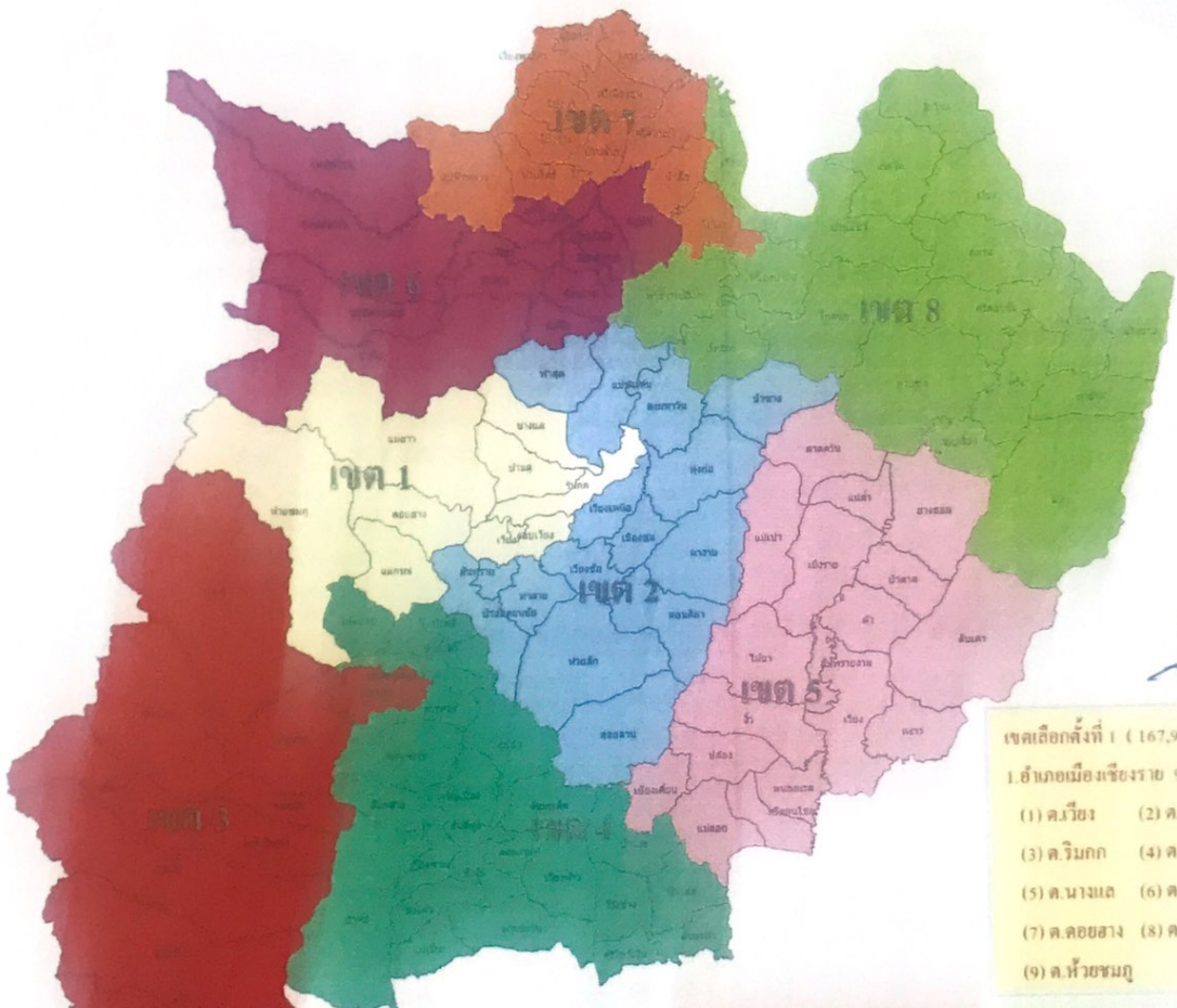
รูปแบบที่ 1

เขตเลือกตั้งที่ 1 ( 167,912 / +3.36% ) 1.อำเภอเมืองเชียงราย 9 ตำบล เฉพาะ (1) คมเวียง (2) ค.รอบเวียง (3) ต.ริมกก (4) ค.บ้านดู่ (5) ต.นางแล (6) ค.แม่ยาว (7) ค.คอยฮาง (8) ค.แม่กรณ์ (9) ค.หัวซมญ