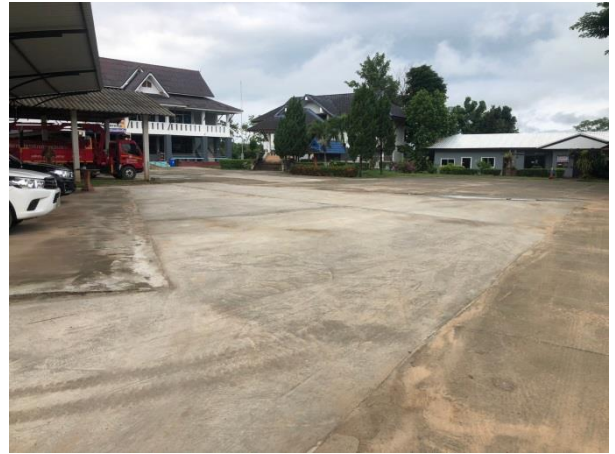
๑๐.) โครงการพนักกันดิน หมู่ ๑บ้านดอยงาม พร้อม วางระบายน้ำ